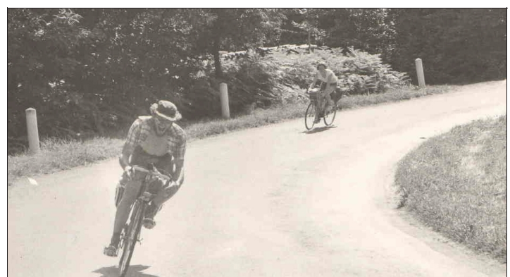
Premier voyage à vélo avec son épouse, en 1981, en Dordogne.