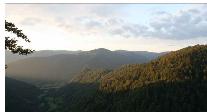
La vallée de la Wormsa, si chère au cœur de Jean-Luc Kaeuffer...